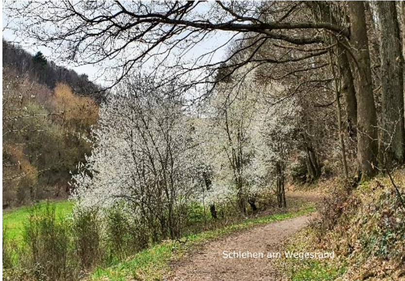
Schlehen am Wegesrand