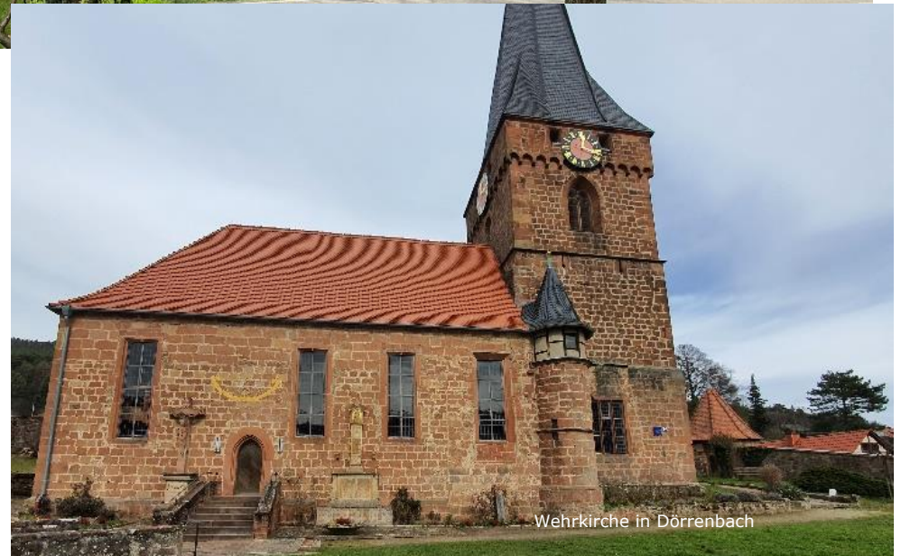
Wehrkirche in Dörrenbach